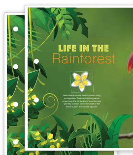
Перфорация 2/4 отверстий