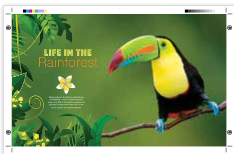
Крупноформатный (A3) отпечаток без полей

Цветной принтер Xerox® VersaLink® C9000 помогает вам создавать печатную продукцию на разнообразных материалах для реализации дизайнерских решений.