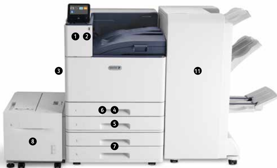
Цветной принтер Xerox® VersaLink® C9000 Печать. Мобильное подключение.